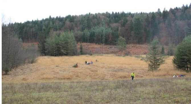
Slika 1.: Planik ob koncu akcije 2011

Zaradi občutljivosti območja delo s stroji ni mogoče, zato bodo vsake pridne roke zelo koristne.