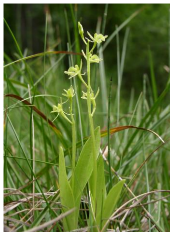
Slika 2.: Orhideja Loeselova grezovka