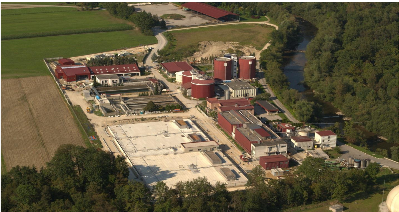
CČN ob zaključku gradnje v letu 2016

Čistilna naprava ves čas spremlja svoje delovanje procesa čiščenja preko on/in line merilnikov ter analiz v laboratoriju. Vsi ključne informacije in signali so vodeni preko centralnega nadzornega sistema, ki omogoča sprotno vodenje procesa čiščenja. Izvedene so bile vse predpisane meritve obratovalnega monitoringa, ki ga izvaja Nacionalni laboratorij za zdravje, hrano in okolje ter meritve na ostalih emisijskih virih. Iz podanega vrednotenja celoletnega delovanja čistilne naprave Domžale-Kamnik lahko zaključimo, da je čistilna naprava učinkovito čistila odpadne vode do zakonodajno predpisanih vrednosti.