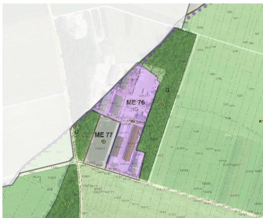
Slika 2: izsek iz veljavnega OPN Mengeš