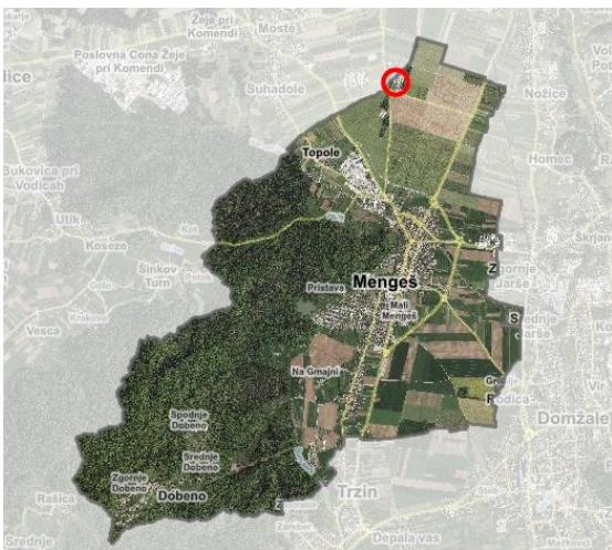
Slika 1: Lokacija načrtovane ureditve na območju občine

Na podlagi prvih mnenj nosilcev urejanja prostora se je izdelal dopolnjen osnutek SD OPN 4, ki bo obravnavan na občinskem svetu in javno razgrnjen.