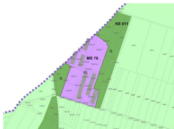
Slika 3: prikaz spremembe namenske rabe v osnutku SD OPN 4