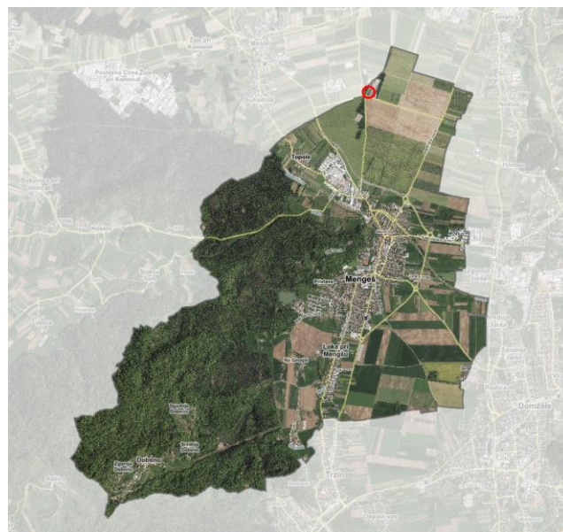
Slika 2: Lokacija načrtovane ureditve na območju občine

Po sprejetju stališča župana do pripomb se bo izdelal predlog SD OPN 4, ki se ga bo posredovalo NUP v druga mnenja.