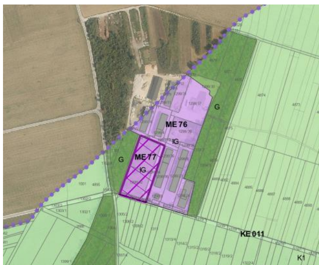
Slika 1: Predlagano območje za spremembo načina urejanja, sprememba podrobnejše namenske rabe prostora

Območja sprememb namenske rabe so razvidna iz grafičnega dela sdOPN4.