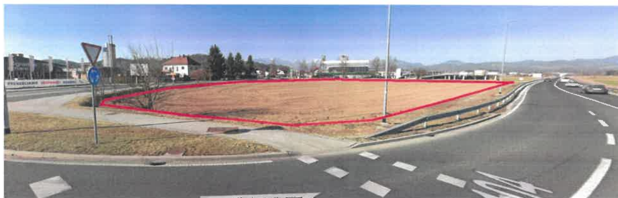
Pogled na območje OPPN iz jugo proti severu