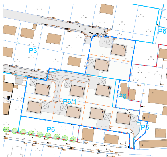
Slika 3: Izsek SD3 OPPN ME 30-S – ureditvena situacija nivo pritličja z zunanjo ureditvijo