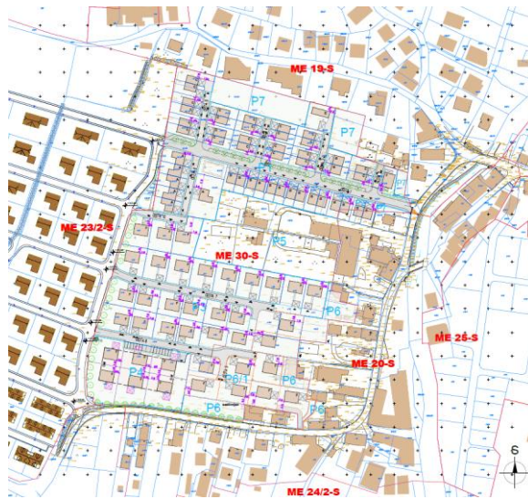
Slika 2: Prikaz ureditve OPPN ME 30-S